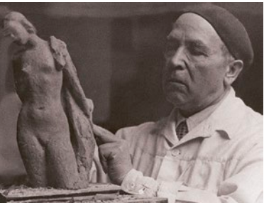
Bernhard Hoetger beim Modellieren, 1936/1942

Bernhard Hoetger (1874–1949) war vielerorts tätig, in Frankreich, Italien, Portugal, der Schweiz und in verschiedenen Regionen Deutschlands. Worpswede und Bremen sind in besonderer Weise mit seinem Namen verbunden. Hier konnte er außergewöhnliche Bauten errichten: das Kaffee Worpswede und die Große Kunstschau im Künstlerdorf, das Paula Becker-Modersohn Haus und das Haus Atlantis in der Bremer Böttcherstraße. In den Museen beider Orte werden wichtige Teile seines künstlerischen Nachlasses bewahrt.