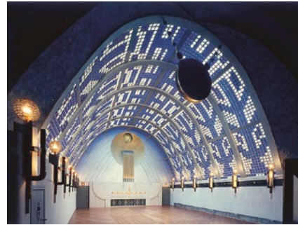
Himmelssaal des Haus Atlantis in der Böttcherstraße nach 1944, © Archiv der Böttcherstraße Bremen, Foto Alfred Rostek

Böttcherstraße, Paula Modersohn-Becker Museum, Himmelssaal im Haus Atlantis